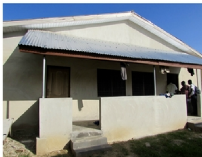
Traktatie van een Ghanese zakenman