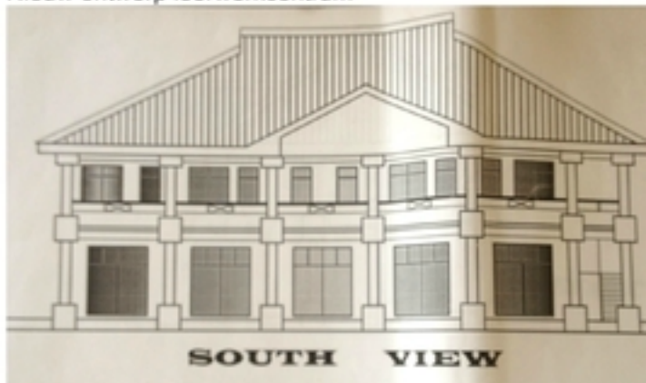
Moederhuis Ashanti School