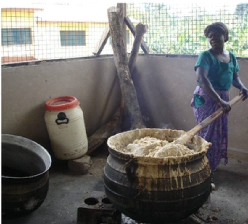
Huismoeders roeren de pap voor 600 leerlingen