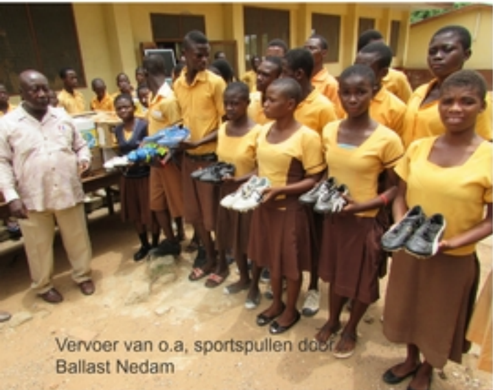
Vervoer van o.a. sportspullen door Ballast Nedam