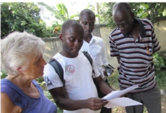
Vergadering SOKPO-bestuur en JCTC-bestuur