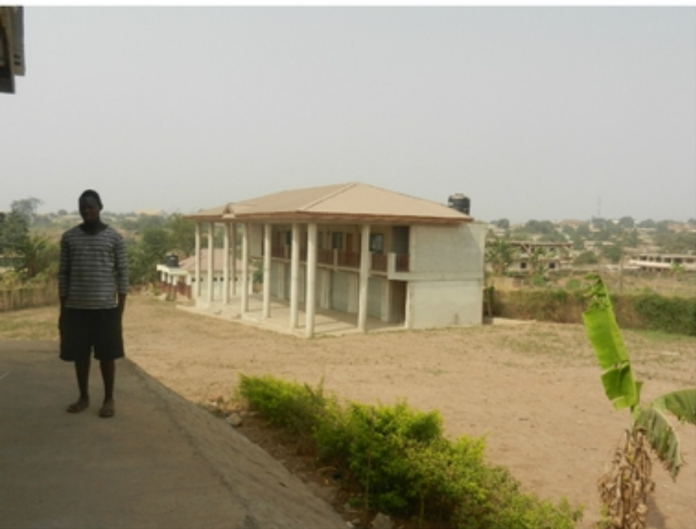
Vijf werkplaatsen leerwerkcentrum