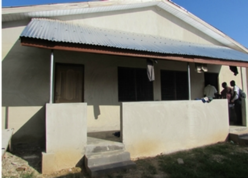
Moederhuis Ashanti School

Geschatte kosten voor ondersteuning en onderhoud 5000 euro per jaar.